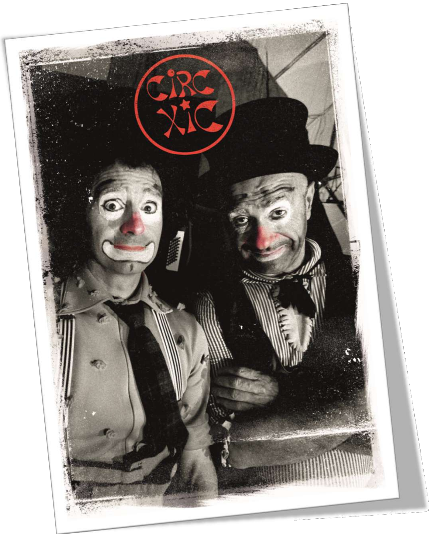
"TEATRE DE FUNÀMBULS"